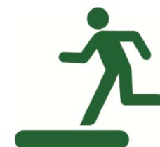
避難場所のマーク